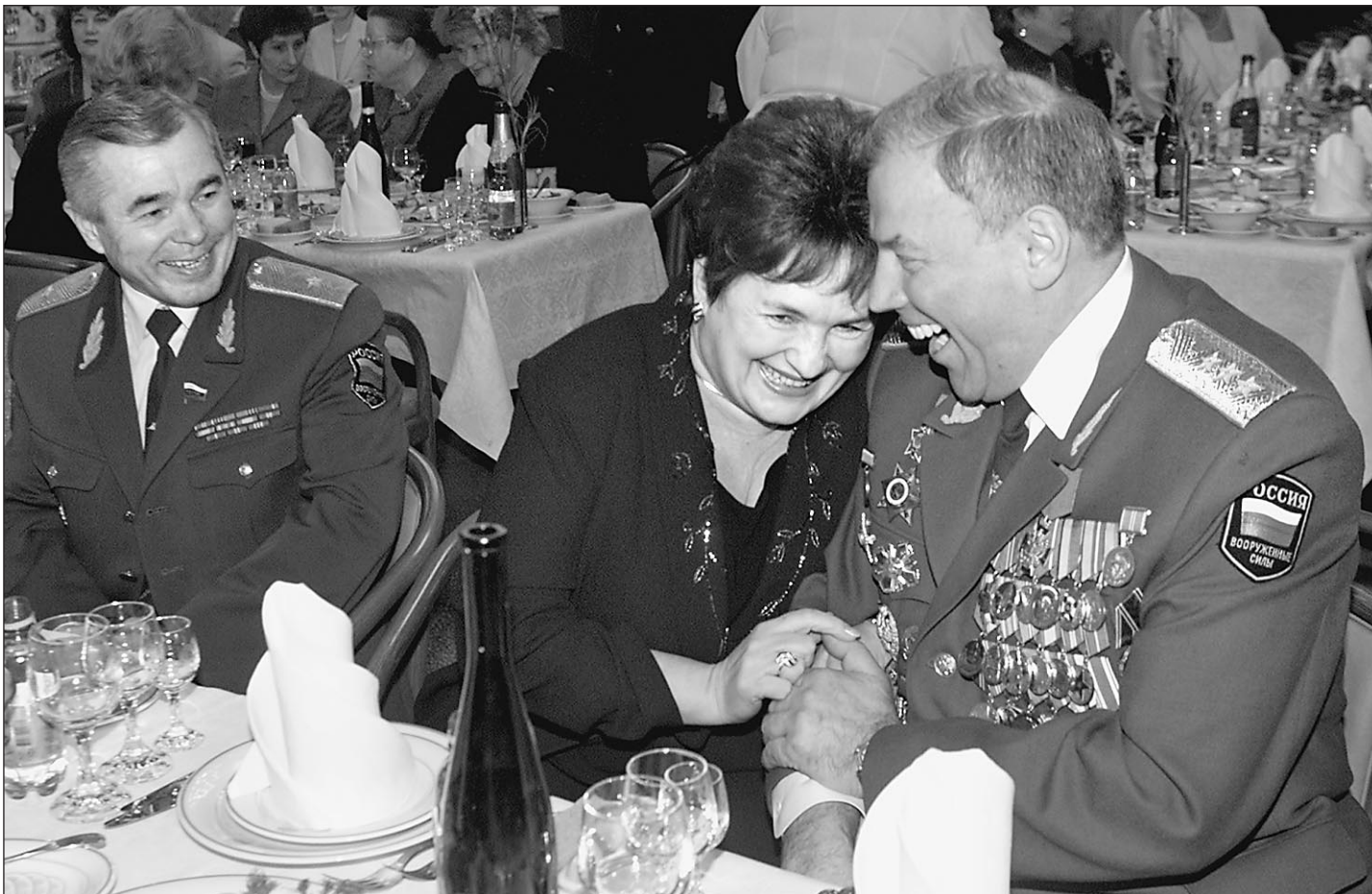
Отдых избранных очень похож на отдых не избранных. Только дороже