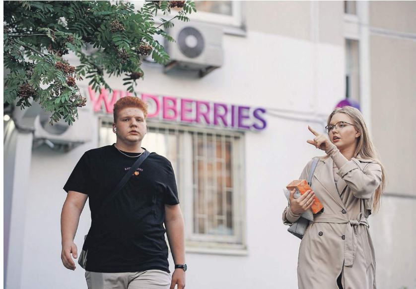
Сергей Лавочкин