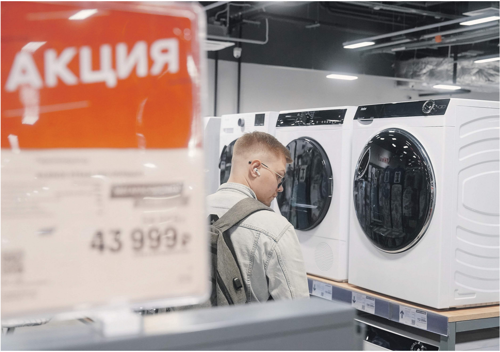
Эдуард Корнилов / Известия