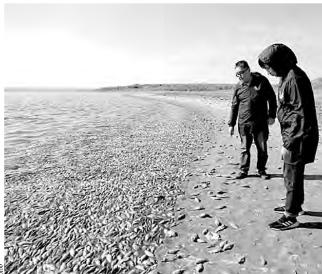
Берег водохранилища был весь усыпан мертвой рыбой.