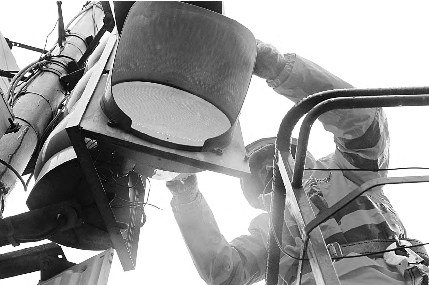
РАЙ ПРОДУКТ / АНДРЕЙ СТАРНИКОВ