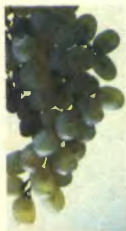
Обложка Э. Бажилина и М. Малисова