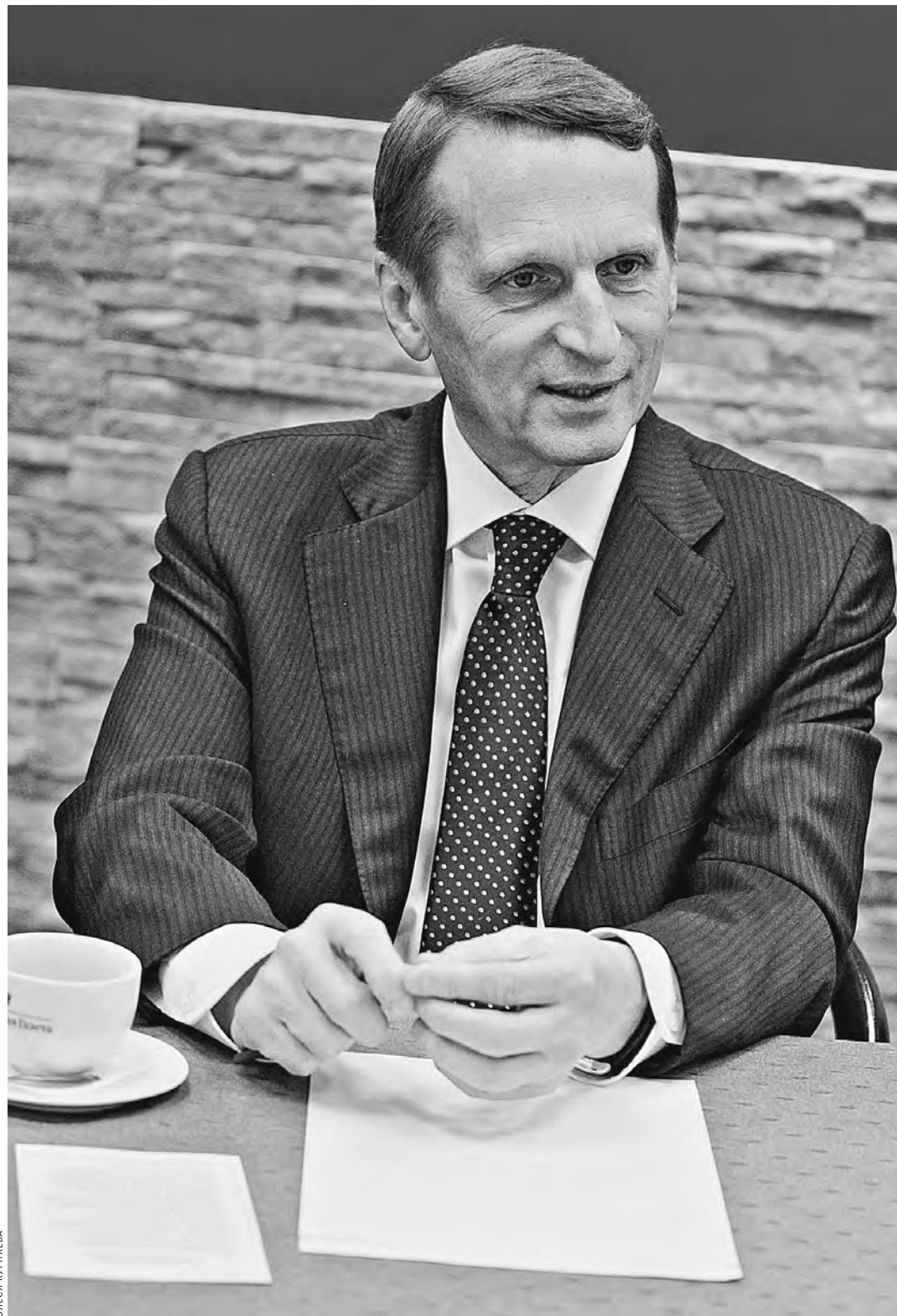
Сергей Нарышкин считает бюджет одним из самых важных законов.

СЕРГЕЙ НАРЫШКИН: Действительно, дискуссия с правительством вокруг бюджета и в первом чтении, и при обсуждении поправок во втором была довольно живая. Нам удалось внести существенные изменения в проект. Например, 20 миллиардов рублей дополнительно направлено в сельское хозяйство, агропромышленный комплекс — на импортозамещение. И еще почти по миллиарду в каждый год с 2015-го по 2017-й добавлено на программу развития рыбохозяйственного комплекса — то есть в ту же копилку обеспечения продовольственной безопасности страны. Понимаете, громко предложить направить