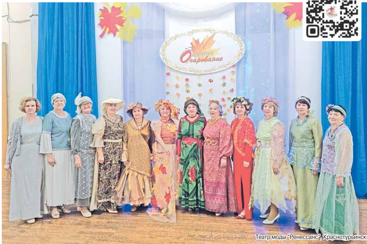
Театр моды «Ренессанс», Краснотурьинск