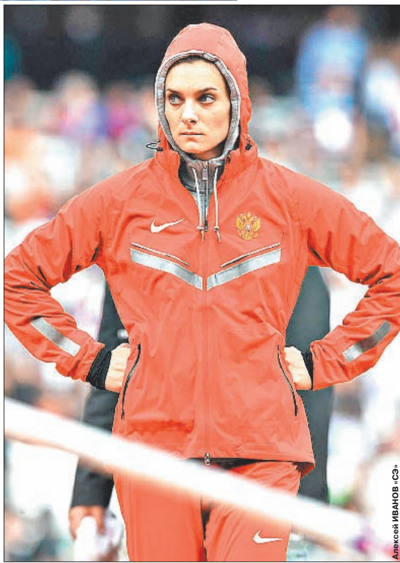
Поедет ли Елена ИСИНБАЕВА и вся олимпийская сборная России в Рио, решится в конце этой недели.