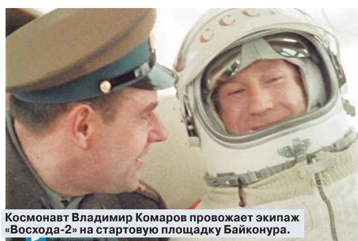
Космонавт Владимир Комаров провожает экипаж «Восхода-2» на стартовую площадку Байконура.