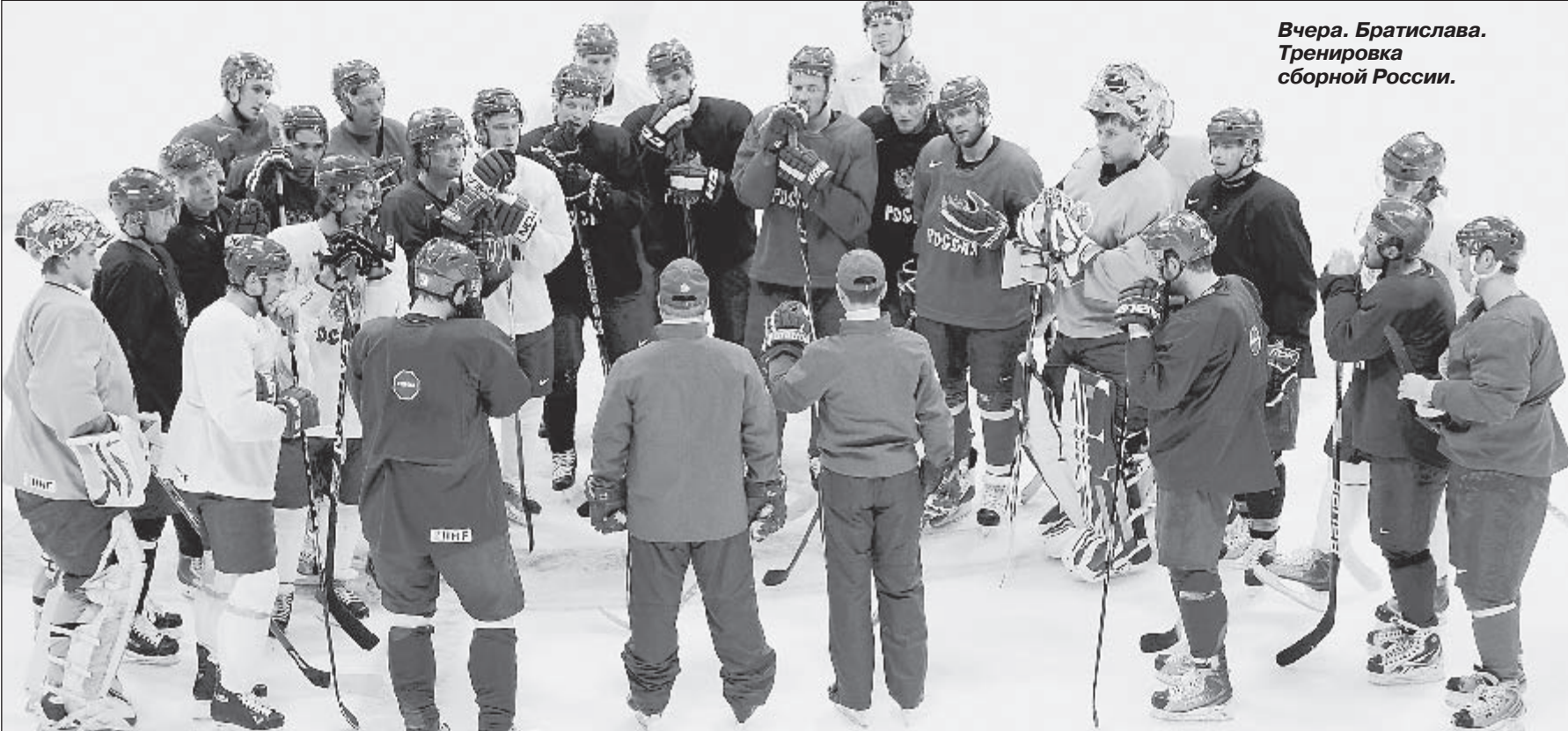
Вчера, Братислава. Тренировка сборной России.