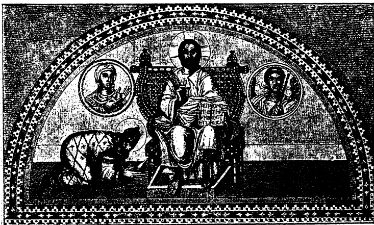
Мозаика Цареградской Софіи.

окружена турецкими владѣніями на самомъ Балканскомъ полуостровѣ. Россія необъединенная вполнѣ, еще неокончательно стряхнувшая съ себя иго татарское, находившаяся подъ властью Василия Темнаго, конечно, не могла спасти Византию отъ гибели, и та молила западъ о помощи. Но тамъ больше думали не о томъ, что нужно дать грекамъ, а о томъ, что нужно взять съ нихъ, и рѣшили взять у нихъ, какъ плату за по-