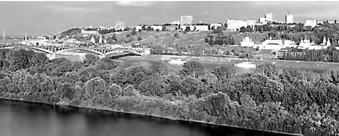
ПРАВИТЕЛЬСТВО НИЖЕГОРОДСКОЙ ОБЛАСТИ

Пятьдесят лет назад на острове был пляж, а сейчас на Гребневских песках шумит лес.