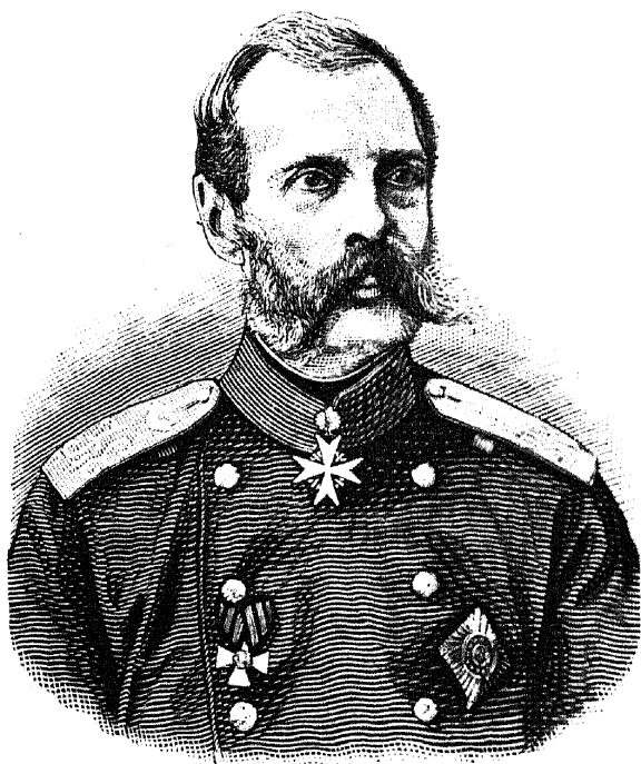
ЕГО ВЕЛИЧЕСТВО ГОСУДАРЬ ИМПЕРАТОРЪ АЛЕКСАНДРЪ II-й.