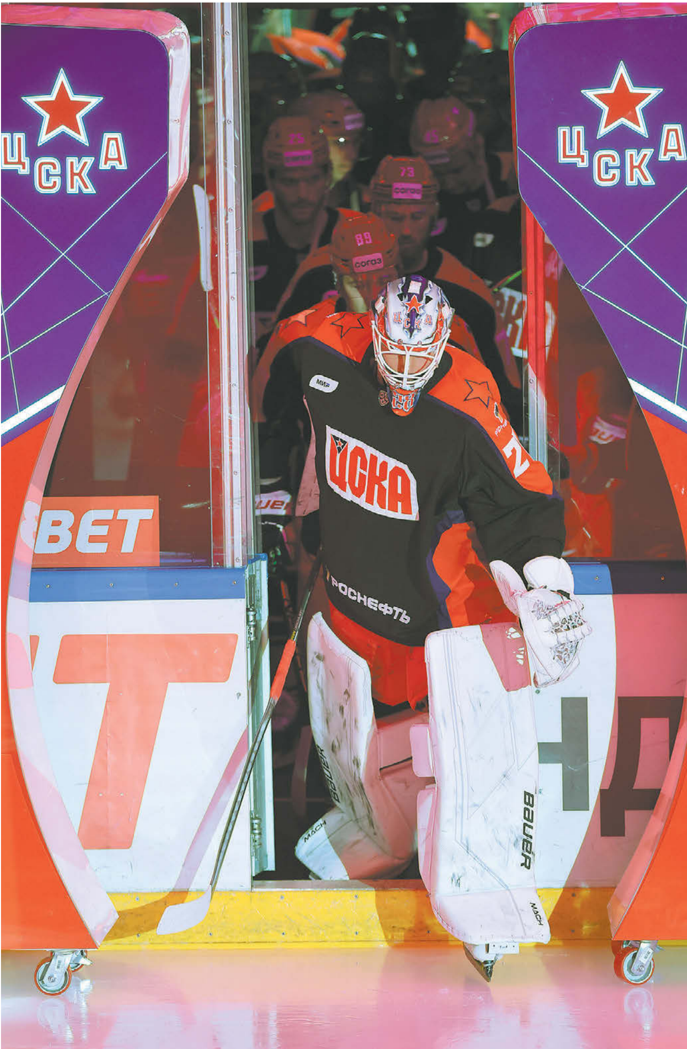
1 сентября. Москва. ЦСКА — «Ак Барс» — 2:5. Вратарь армейцев Иван Федотов выходит на лед в матче — открытии регулярного чемпионата КХЛ-2023/24