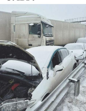
ПРОКУРАТУРА МОСКОВСКОЙ ОБЛАСТИ