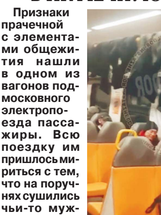
ПРОКУРАТУРА МОСКОВСКОЙ ОБЛАСТИ

Признаки прачечной с элементами общежития нашли в одном из вагонов подмосковного электропоезда пассажирам. Всю поездку им пришлось мириться с тем, что на поручнях сушились чьи-то мужские вещи — вплоть до носков и трусов. Как стало известно «МК», наблюдать за сушкой чужого белья довелось в среду утром пассажирам, которые ехали из Железнодорожного в Апрелевку. Помимо одежды на всеобщее обозрение был вывешен даже плед. Некоторые любознательные пытались найти чистоплотного автора перформанса, но не смогли. А позже выяснилось, что постирщику уже не в первый раз заставляли охранники поезда — ранее все их исподнее уже лицезрели другие пассажиры. Дело в том, что