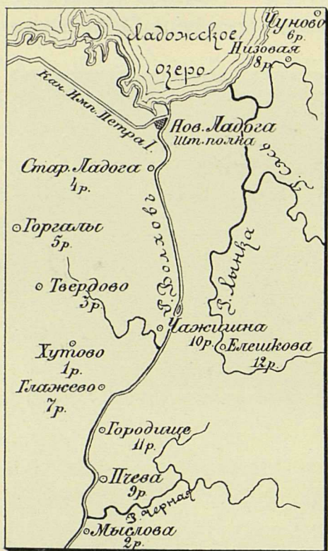
Расположеніе полка по квартирамъ въ 1776 — 82 гг. Масштабъ 1:840000.

это вмѣстѣ взятое грозило Воронцову полнымъ паденіемъ. Но внезапная кончина Императрицы и воцареніе Императора Павла I-го круто измѣнили положеніе дѣлъ; графъ Воронцовъ, въ первые-же дни новаго царствованія, былъ произведенъ въ генералы отъ инфантеріи и назначенъ чрезвычайнымъ и полномочнымъ посломъ въ Лондонъ. Затѣмъ въ 1797 году, въ день коронаціи Императора Павла, онъ былъ пожалованъ орденомъ Св. Андрея Первозваннаго и награжденъ имѣніемъ въ Финляндіи.