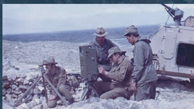
ВОЗВРАЩЕНИЕ К ЗАБЫТОМУ