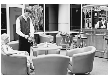
Специалисты подозревают, что в отравлении «виновата» курица с помидорами