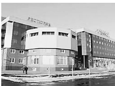
В ЦЕНТРЕ «СИБИРЬ» 1 марта собралось 1,5 тысячи человек