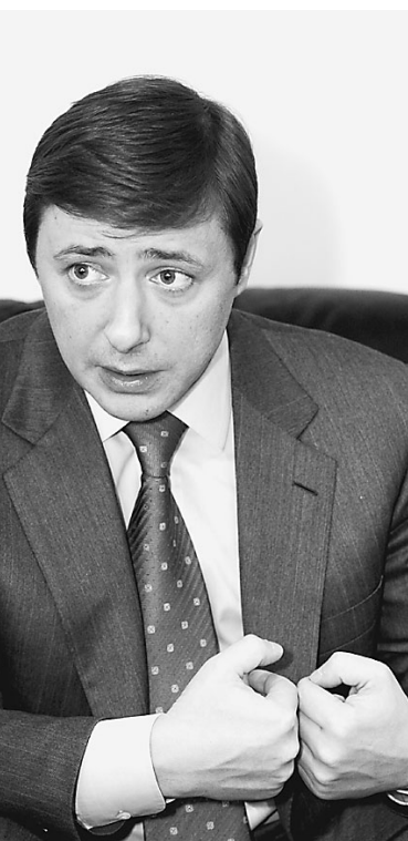
Губернатор Хлопонин был вне себя от ярости

Красноярский выставочный центр «Сибирь» принимал у себя полторы тысячи лучших студентов края. Девушки в балльных платьях и ребята в смокингах попали на ежегодный IQ-бал, устраиваемый губернатором Александром Хлопонинным, за успехи в учебе. В крае попасть на такое мероприятие очень престижно. Однако торжество обернулось неприятностями: на вчерашний день уже 150 участников бала отравились.