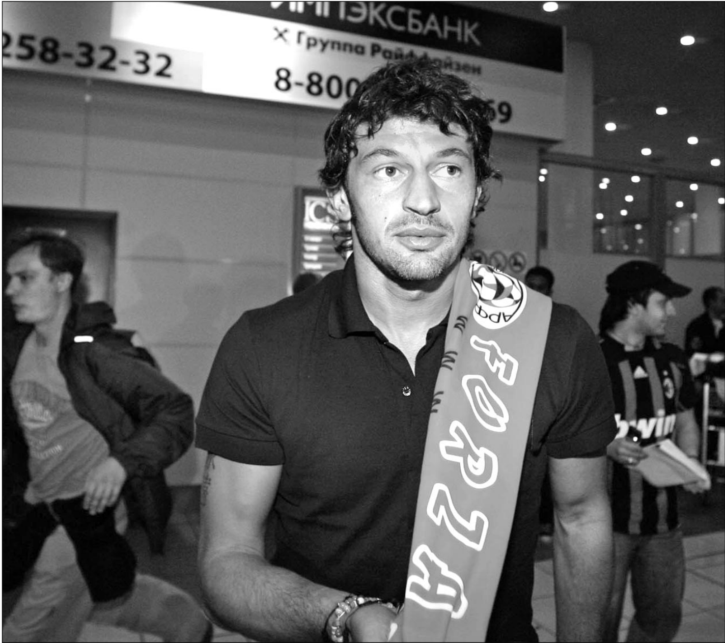
Вчера. Внуково. Защитник «Милана» Каха КАЛАДЗЕ.