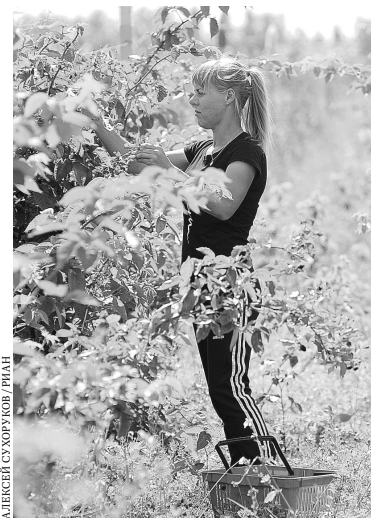
Ручной сбор ягод уходит в прошлое, так как не позволяет наращивать объемы производства.