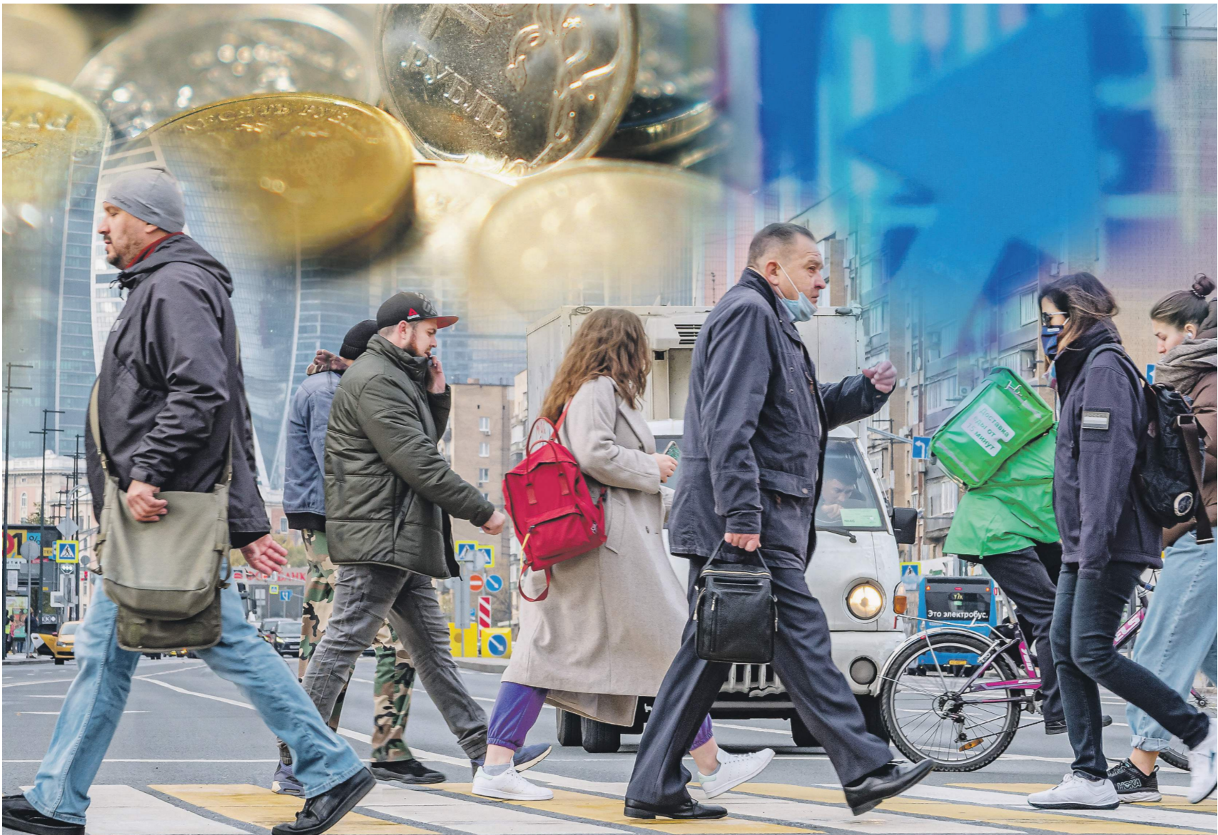
Москва заняла 17-е место в рейтинге регионов по инфляции — 10,09%