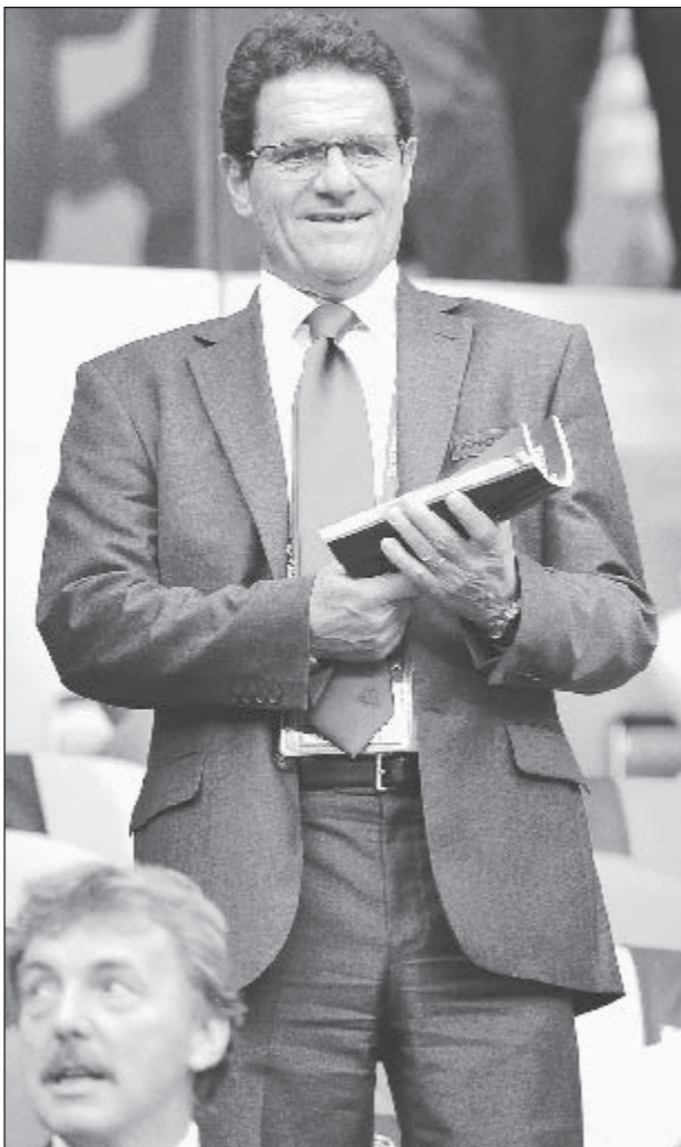
12 июня. Варшава. Польша - Россия - 1:1. Случайно ли Фабио КАПЕЛЛО оказался на этом матче?..

Вчера Фабио Капелло, как сообщает Sky Sport Italia, вместе со своим сыном и одновременно агентом Пьерфилippo вьетел в Россию для улаживания последних формальностей с РФС. Ожидается, что в ближайшие дни 66-летний специалист поставит подпись под контрактом, по которому станет главным тренером сборной России до окончания чемпионата мира-2014 в Бразилии. Вопрос, который сейчас больше всего волнует и болельщиков, и игроков: каковы будут первые шаги итальянца в нашей стране? Что ж, вскоре узнаем, а пока вспомним, с чего Капелло начинал в Англии.