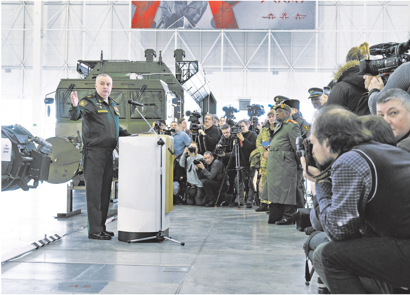
Генерал-лейтенант Михаил МАТВЕЕВСКИЙ дал ответ на все вопросы.

В этой связи Минобороны России максимально открыто и детально предоставило инфор-