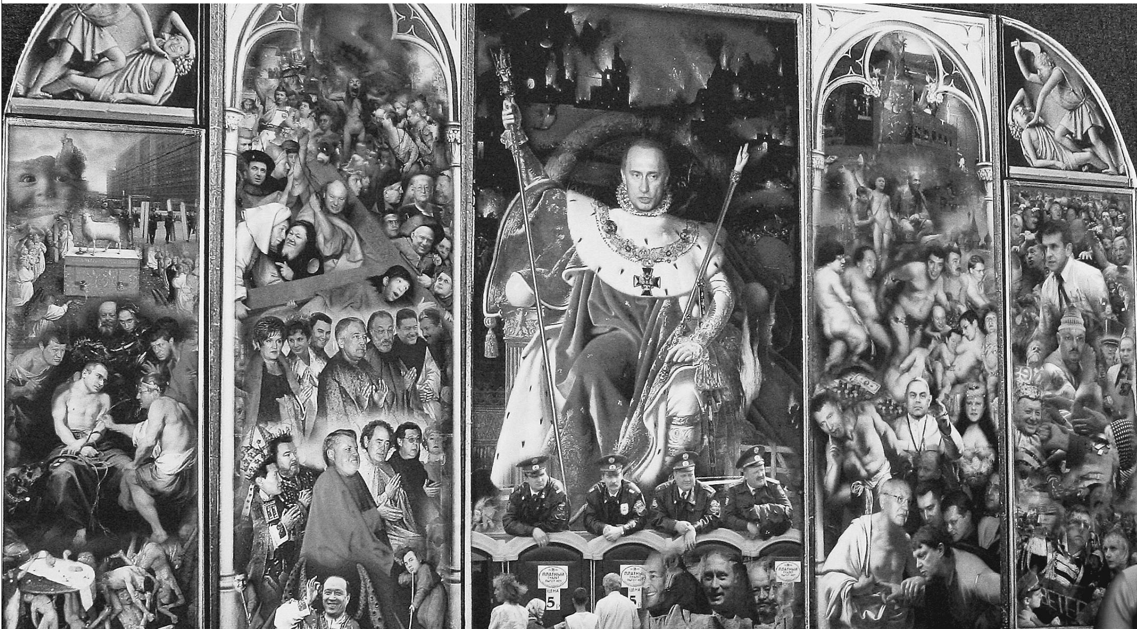
Друзья и недруги Путина. Фрагмент композиции, выставленной на Международной художественной ярмарке «Арт-Манеж 2005»

Оказалось, противники, как и насекомые, бывают полезные и вредные