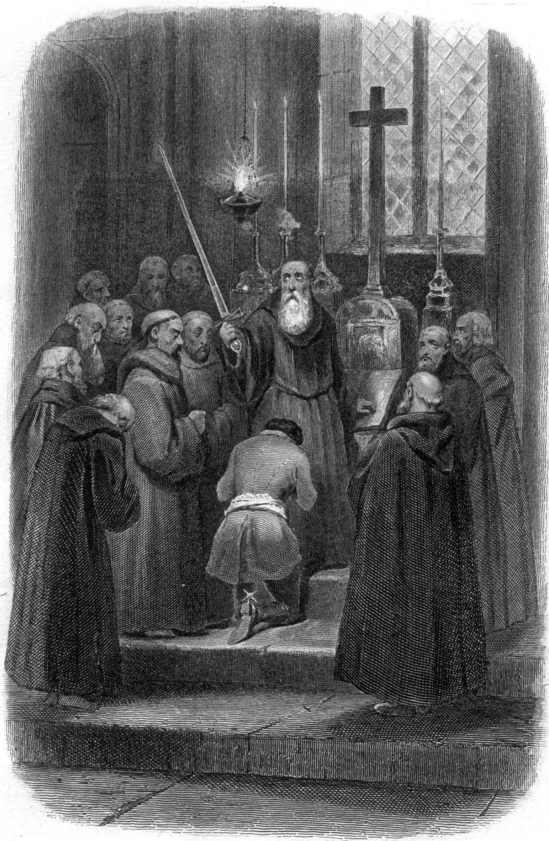
CHATEAUBRIAND CHEVALIER DE MALTE.