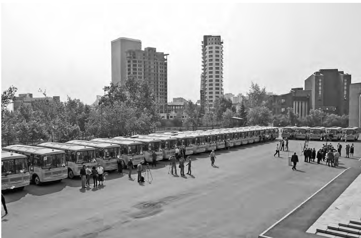
ПРАВИТЕЛЬСТВО КРАСНОЯРСКОГО КРАЯ

В районы Красноярского края поступили 25 новых школьных автобусов