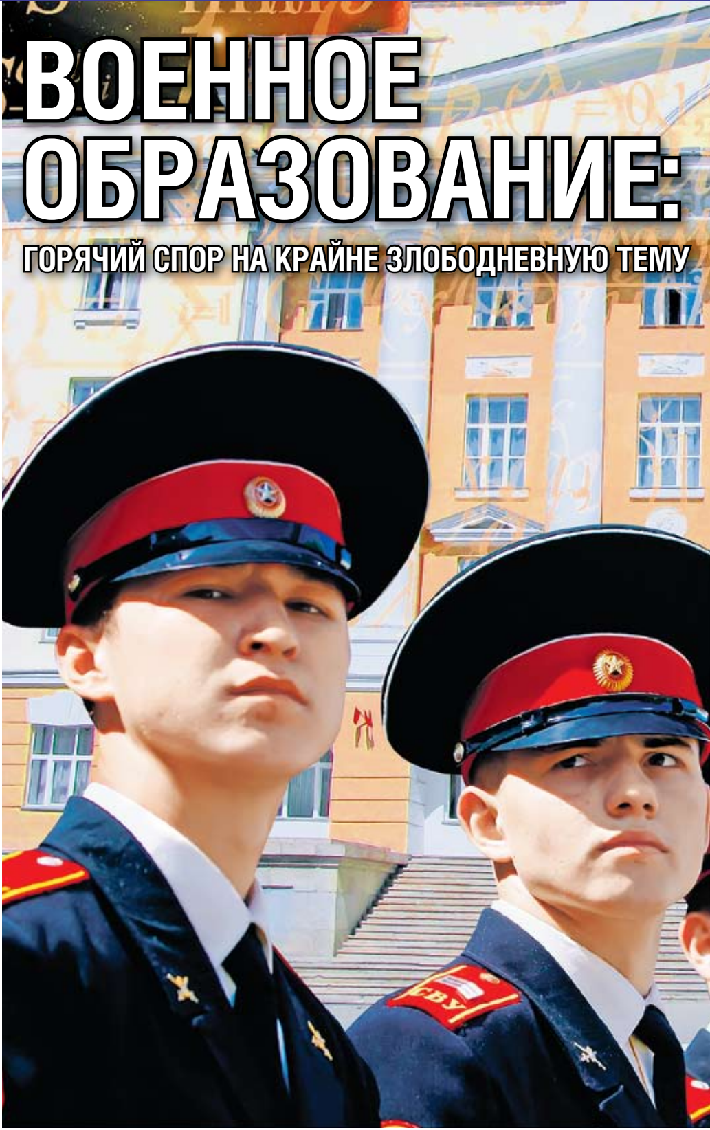
Коллаж Андрея СЕДУХА

Дело в том, что пришедшие в Министерство обороны гражданские люди, к большому сожалению, не признают особого характера военной службы. При всем моем уважении к гражданским профессиям нужно признавать, что есть единственная профессия – офицер, которая наделяет человека правом отдавать приказы в боевой обстановке. Очень важно знать, что за человек стоит за таким