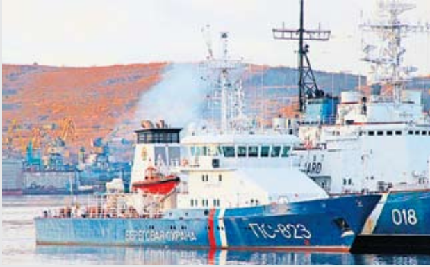
По сообщениям корреспондентов «ВПК», информантства АРМС-ТАСС и Интерфакс-АВН

Корабль проекта 22100 имеет стандартное водоизмещение около 2700 тонн и усиленный ледовый класс. Энергетическая установка состоит из германских дизельных двигателей MTU. ПСКР данного типа по ТТХ фактически соответствует сторожевому кораблю ближней морской зоны ВМФ (корвету) – кораблю третьего ранга, однако не несет ударного, противозушного и противолодочного вооружения. Спроектирован специально для пограничной службы, а не передан из единицы флота. Широко используются зарубежные системы.