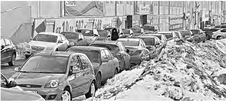
Стихийные парковки мешают уборке дорог от снега.

Чтобы разгрузить улицы Саратова от припаркованных автомобилей, в дальнейшем планируется приобрести еще четыре таких видеокomплекса. В министерстве транспорта и дорожного хозяйства корреспонденту «РГ» сообщили, что работа мобильных комплексов не будет пересекаться с работой служб, которые сейчас занимаются эвакуацией неправильно припаркованных автомобилей. – Они будут обслуживать разные сектора в городе, – объяснили в пресс-службе ведомства. С начала этого года в Саратове с подачи муниципальной власти активизировалось обсуждение планов по организации в центре города зон платной парковки. В свою очередь представители общественности заявляли, что проблему необходимо решать в комплексе и прежде выработать концепцию транспортного развития муниципалитета. Пока, как считают в Общественной палате Саратовской области, у местной власти отсутствует видение, как решать эту проблему. Андрей Куликов, Саратов