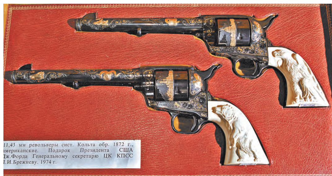
11,43 мм револьверы сист. Кольта обр. 1872 г., американские. Подарок Президента США Дж. Форда Генеральному секретарю ЦК КПСС Г.И. Брежневу. 1974 г.

Объясняет минтруд свою по- зицию тем, что право делать до- рогие подарки государственным и муниципальным служащим не создает преференций для разви- тия народных промыслов. Но зато сформирует негативное от- ношение в обществе к дарению подарков чиновникам, на кото- рых распространяются антикор- рупционные стандарты.