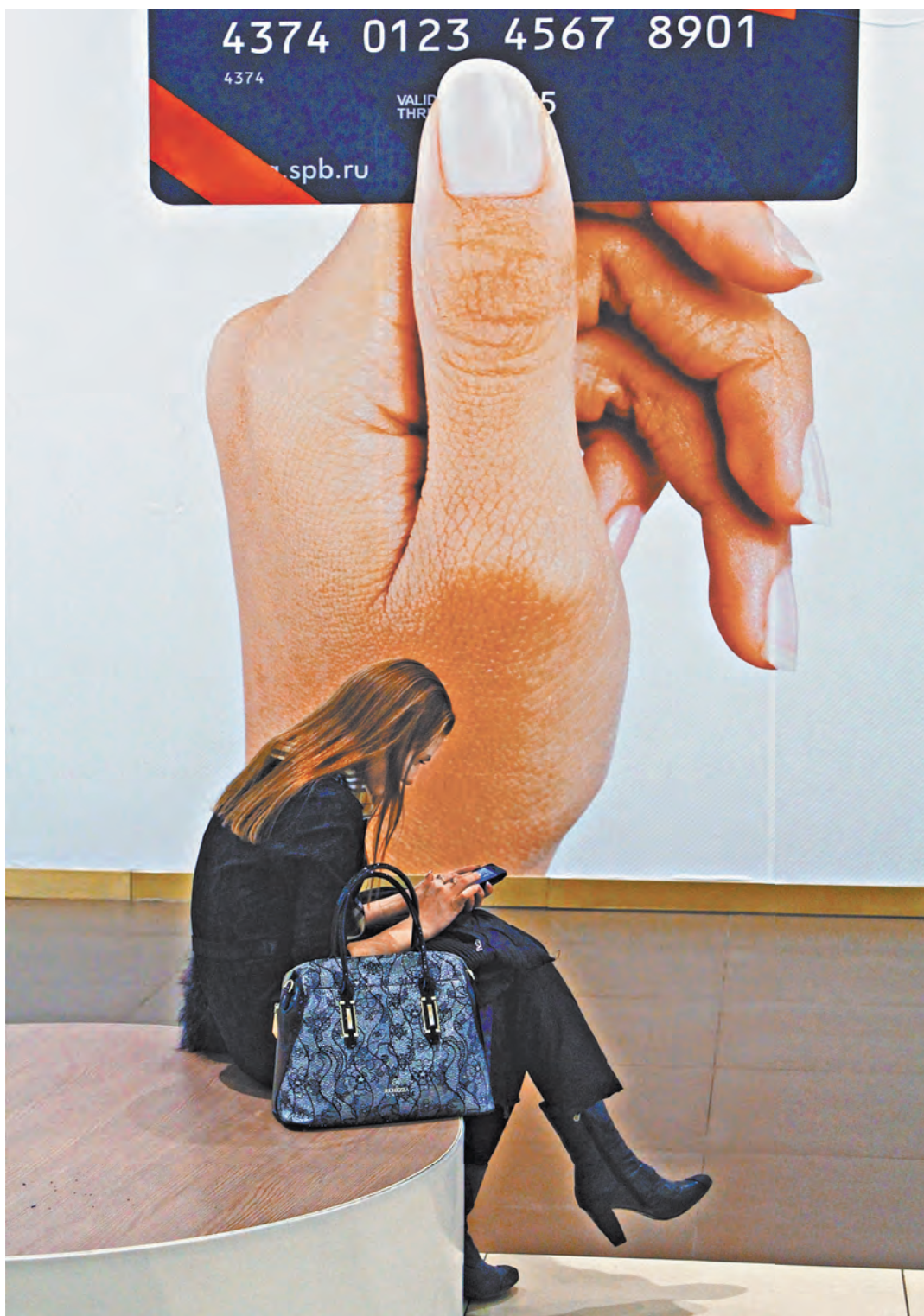
Из-за ограничения процентов по микрозаймам самым «рискованным» заемщикам в долг никто не даст.

Именно опасения толкнуть наиболее незащищенные слои населения в сторону «черных кредиторов», не связанных ника- кими ограничениями, заставля- ли ЦБ достаточно аккуратно «подтягивать» сектор МФО по- сле принятия его в свое ведение в 2014 году. Потребность людей в микрозаймах остается устойчи- во высокой — в январе — марте их выдано 5,7 миллиона.