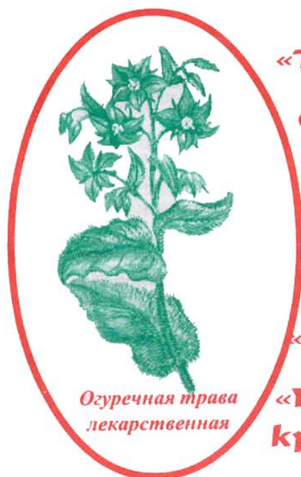
Огуречная трава лекарственная