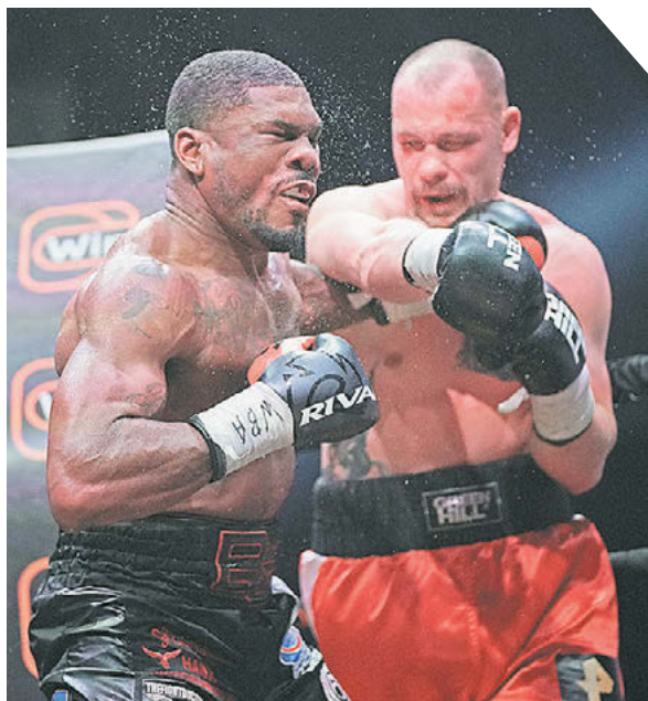
Сергей Лантохов «Известия»