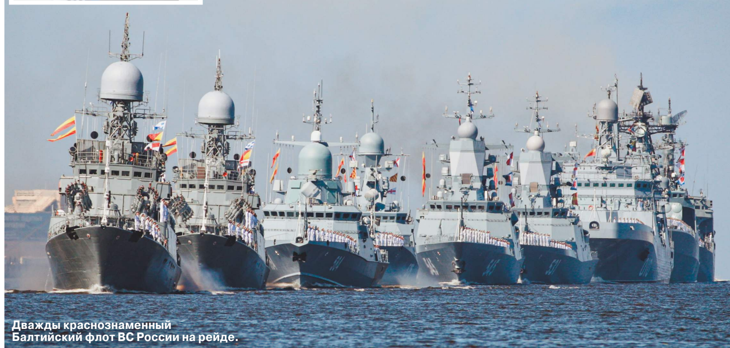
Дважды Краснознаменный Балтийский флот ВС России на рейде.

Был такой в 90-е годы анекдот, точно отражавший мечты «младореформаторов» и «демократов»: а давайте объявим войну Америке и сразу сдадимся. Вот