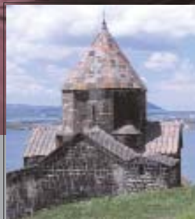
EMV Safari 2006