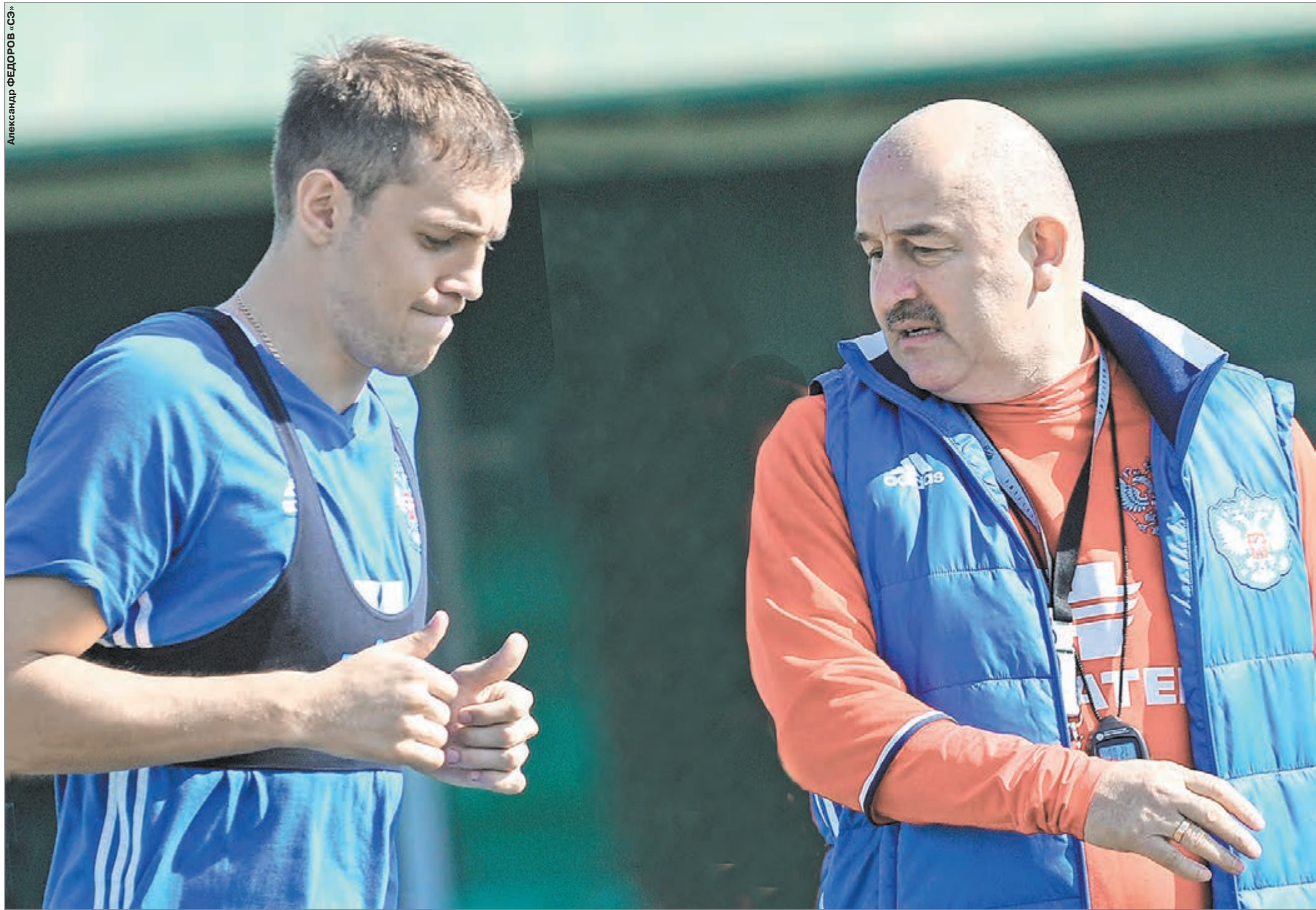
Октябрь 2016 года. Краснодар. Артем ДЗЮБА и Станислав ЧЕРЧЕСОВ на тренировке сборной России.