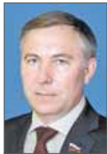
Александр Варфоломеев, член Совета Федерации от Республики Бурятия

После выступления Владимир Пучков ответил на вопросы сенаторов.