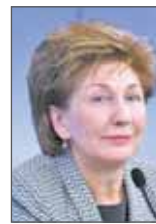
Галина Карелова, член Совета Федерации от Воронежской области

ный пункт отстояли, но выводы соотвествующие должны сделать все, кто отвечает за эту тему. Я уверен, что совместными усилиями мы задачу решим.