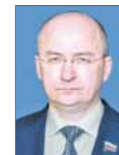
Олег Цепкин, член Совета Федерации от Челябинской области

И конечно же, важнейшее направление работы МЧС России — постоянная тренировка работников данных учреждений. И еще тема, которую мы держим на контроле, — это повышение уровня заработной платы и социальной защищенности медперсонала, работающего в этих стационарных лечебных заведениях. Я уверен, что комплексные мероприятия, которые мы реализуем, позволят обеспечить безопасность пациентов.