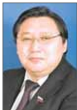
Александр Акимов, член Совета Федерации от Республики Саха (Якутия)

ван сегмент космического мониторинга и прогнозирования опасностей и угроз, строятся дополнительные пожарно-спасательные части, и я уверен, что это позволит нам на высочайшем уровне провести чемпионат мира по футболу.