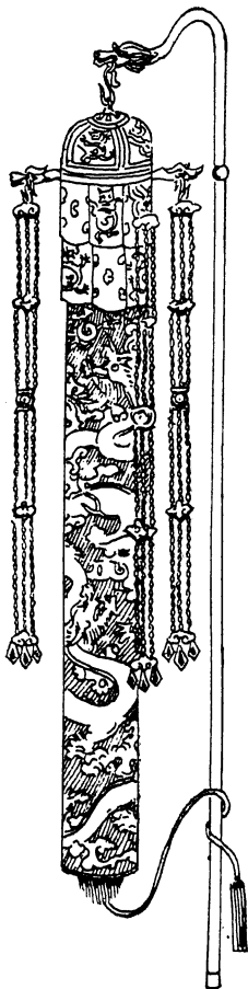
Kiè, sceptre impérial de délégation, marque du mandat de l'Empereur.