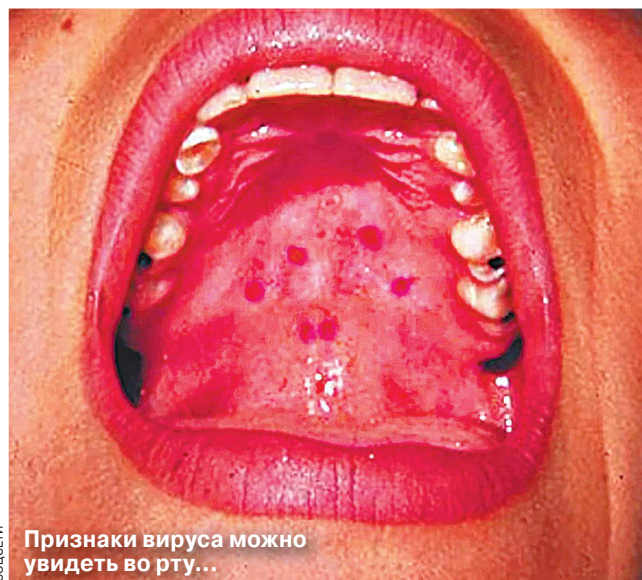
Признаки вируса можно увидеть во рту...