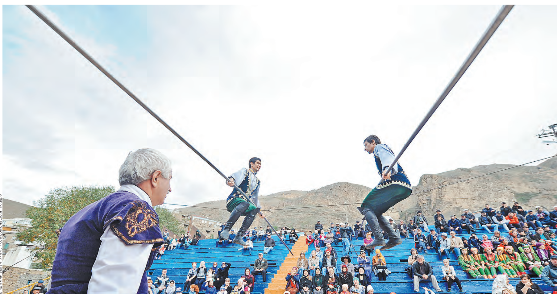
Новому премьеру Дагестана Артему Здунову предстоит найти баланс в развитии не только экономики, но и в общественной жизни республики.