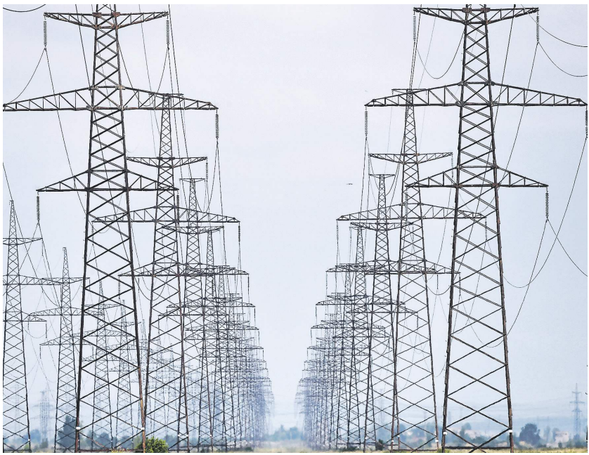
Илья Елизаров / РИА Новости

Согласно отчёту экспертной подгруппы по кибербезопасности НТИ «Энерджинет», сформированному по результатам опроса компаний, более 80% отечественных производителей вторичного оборудования для электроэнергетики используют иностранную электронную компонентную базу (ЭКБ), 40% компаний — зарубежное программное обеспечение (ПО). Бизнес объясняет это низкой конкурентоспособностью российских разработок и зрелостью иностранных решений. Об этом сказано в отчёте экспертной подгруппы по кибербезопасности НТИ «Энерджинет» по результатам опроса компаний. С документом ознакомились «Известия».