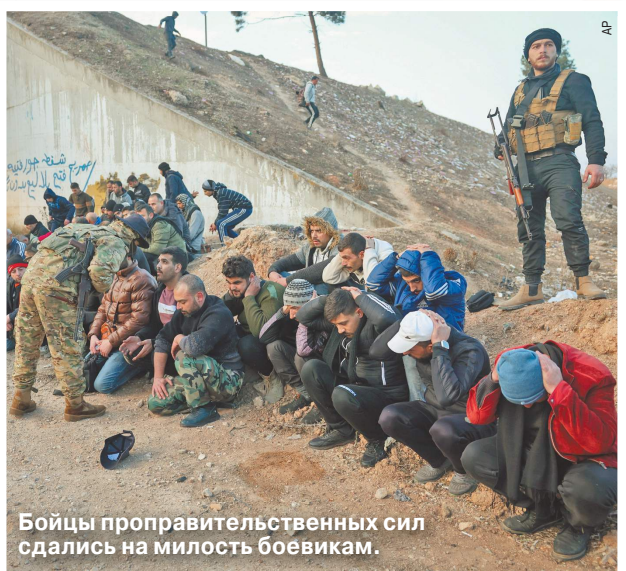
Бойцы проправительственных сил сдались на милость боевикам.

«У победы тысяча отцов, а поражение всегда сирота»