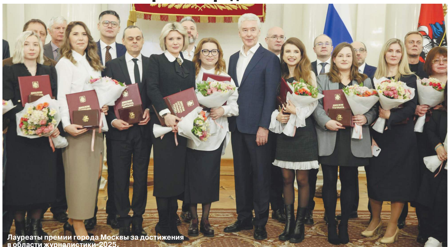
Лауреаты премии города Москвы за достижения в области журналистики-2025.

В День российской печати журналист «МК» стал лауреатом премии города Москвы