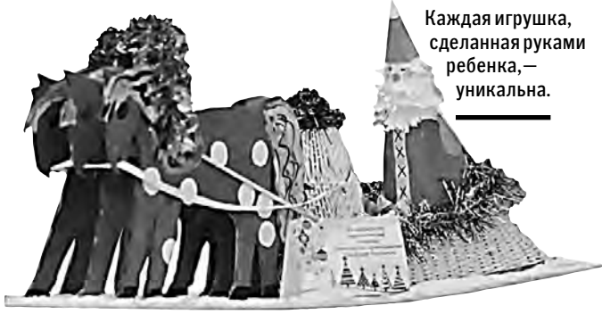
Каждая игрушка, сделанная руками ребенка, — уникальна.

«Уникальные елочные украшения и сувениры, новогодние поздравительные открытки, сделанные воспитанниками детских домов и социально-реабилитационных центров Удмуртии с любовью и надеждой, принесут в дома тепло, добро и счастье», — уверены в правительстве региона. Яна ШАМАЕВА, ИЖЕВСК