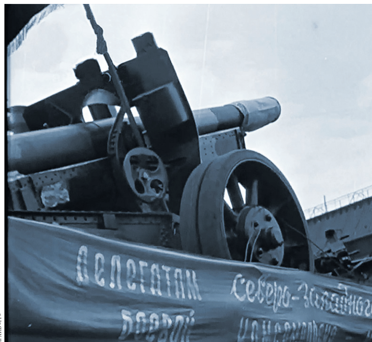
Рабочая молодежь подарила фронту 16 артиллерийских батарей.

Как рассказали авторы проекта, в годы Великой Отечественной войны работала Центральная студия кинохроники, снимавшая «Союзкиножурнал». В 1942 году в выпуске № 68 оператор Борис Шер на заводе имени Молотова (в настоящее время — ПАО «Мотовилихинские заводы») сделал сюжет о прибытии делегации Северо-Западного фронта. «Военные принимали пушки, построенные руками комсомольцев и молодежи за-