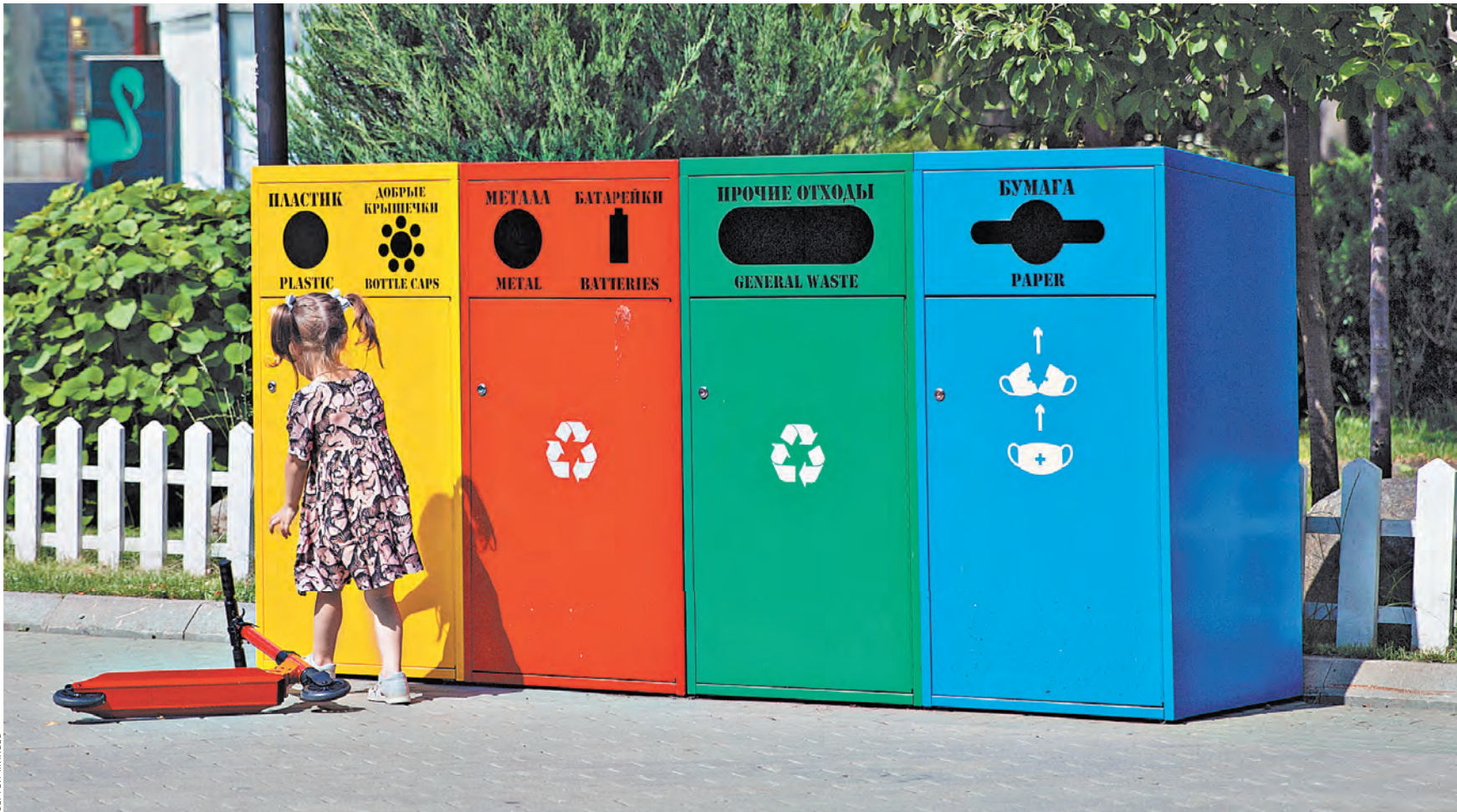
Вынести мусор — как собрать детскую головоломку: пластиковую бутылку из-под газировки надо бросить в красный контейнер, а эту газету, когда дочитаете, — в синий.