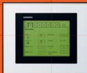
ГАММА Автоматика зданий EIB/KNX