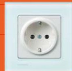
ДЕЛТА Розетки, выключатели, и все, что необходимо

ООО «СИМЕНС» А&Д ЕТ Россия Департамент техники автоматизации и приводов Отдел «Электроустановочное оборудование и техника автоматики зданий InstaBus EIB/KNX от А до Я!» Тел.: +7 (495) 737 2294, 2387, 2397, 2395 +7 (495) 223 3774 Факс: +7 (495) 737 2306, 2483 Техника автоматизации зданий InstaBus EIB/KNX: Тел.: +7 (495) 737 2338 e-mail: nikolai.frolov@siemens.com 115114, Москва, ул. Летниковская, 11/10-2 http://www.siemens.ru/ad/et