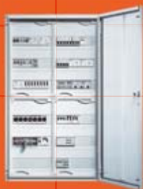
АЛФА Шкафы и щиты