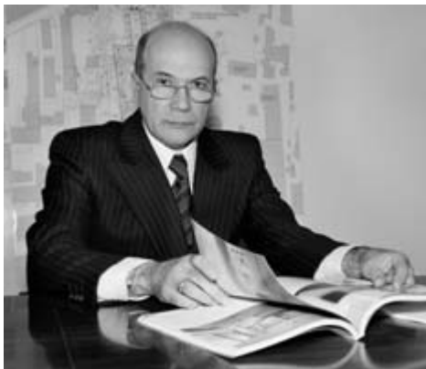
Генеральный директор «Моспроект-4», доктор архитектуры, действительный член МААМ, член-корреспондент РААСН, член Европейского общества культуры, Почетный строитель Москвы АНДРЕЙ ВЛАДИМИРОВИЧ БОКОВ:

Издательство «АРД-центр» и редакция журнала «Технологии строительства» предлагают вашему вниманию третий выпуск ежегодного каталога «КАЧЕСТВЕННАЯ АРХИТЕКТУРА 2006». В сборник включены реализованные в последние годы архитектурные проекты, отобранные авторитетной комиссией, в состав которой вошли известные представители московской архитектурной общественности. О том, какие критерии оценки легли в основу выбора объектов для публикации в сборнике «КАЧЕСТВЕННАЯ АРХИТЕКТУРА 2006», рассказывают члены комиссии.