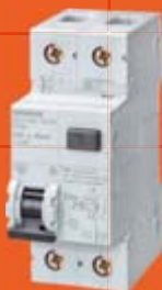
БЕТА Аппаратура модульного исполнения