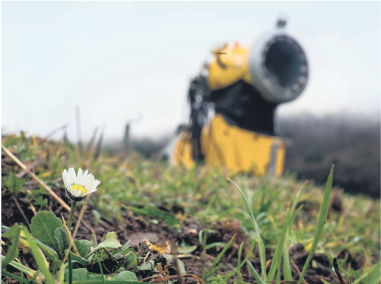
По январскому теплу расцвели надежды ЕС легко пережить зиму без российского газа

Этой зимой начиная с 4 января «Газпром» стал снижать поставки в Европу через Украину с привычного уровня 42 млн кубометров в сутки до 35,5 млн кубометров в сутки к 8 января. Компания не назвала причину, но это может быть связано с резким похолоданием на большей части территории России в первой половине января. Потребление газа для генерации энергии и нужд отопления существенно возросло, и, хотя у «Газпрома» в принципе сей-