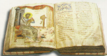
Евангелие аптаркос. Новгород. Середина XIV века

«Изучение документов минувших эпох вне прямого их использования в качестве источника исторических сведений (то есть изучение их как памятника прошлого, следа старой культуры) имеет археографическую ценность»