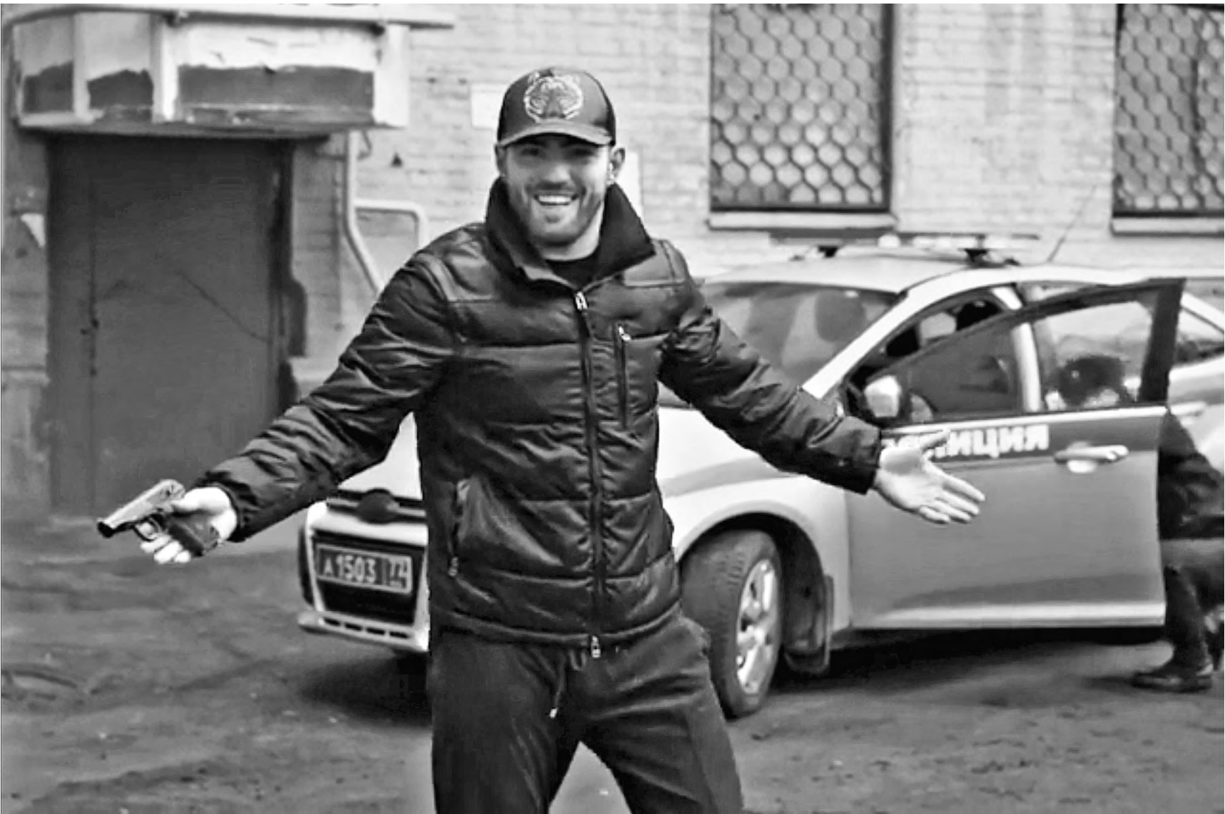
Блогер Хизри Запиров, 4,2 млн подписчиков, зарабатывает инсценировками нападения на полицию, девушек и даже пранкует как каннибал, но всегда юридически неуловим.