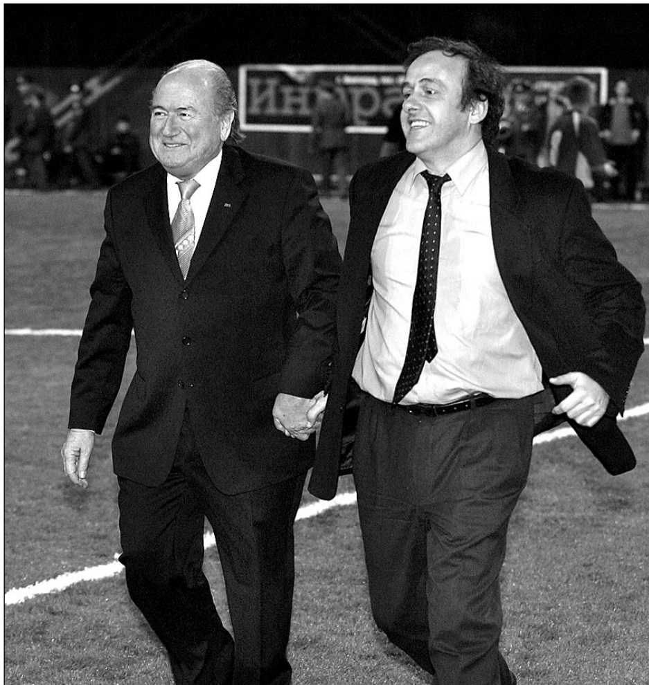
Суббота. Москва. Манеж «Динамо». Йозеф БЛАТТЕР (слева) и Мишель ПЛАТИНИ.

В субботу после пресс-конференции на стадионе «Динамо» корреспондент «СЭ» Александр ПРОСВЕТОВ взял интервью у президента ФИФА Йозефа Блаттера и члена исполкома ФИФА Мишеля Платини